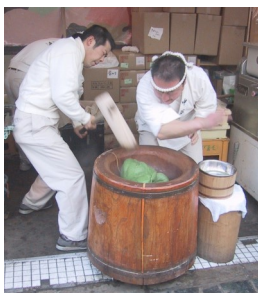
Mochitsuki, pétrissage du mochi, réalisé fin décembre en vue des festivités du nouvel an

Cette pâtisserie se déguste pendant la cérémonie du thé ou lors du nouvel an. Sa préparation peut alors se faire en public.